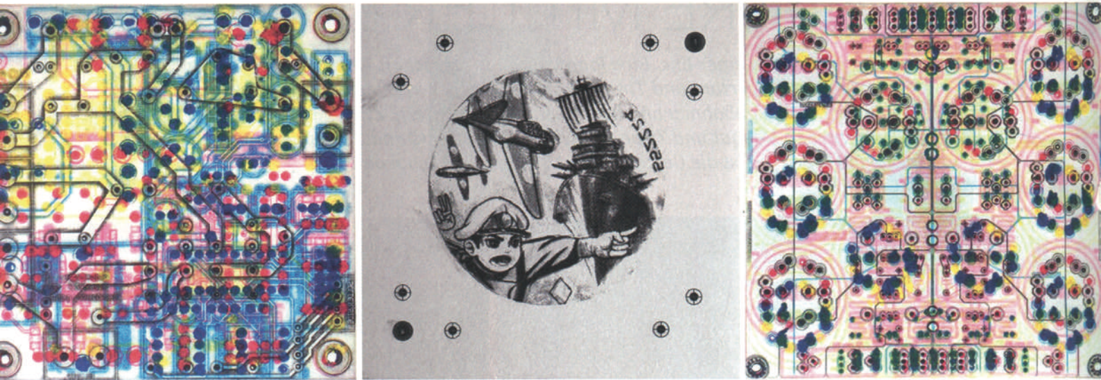
li.: AS full color (2017), ca. 10 x 10 cm / Mi.: Zureta (2017), ca. 15 x 15 cm / re.: AS full color (2017), ca. 15 x 15 cm jeweils Polymertiefdruck auf Hahnemühle-Büttenpapier