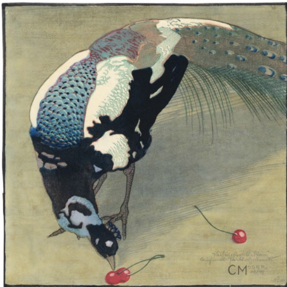
1 Carl Moser, Weißgefleckter Pfau / White-speckled Peacock, ca.1919, Farbholzschnitt / color woodcut, 31 x 31,2 cm, Sammlung / Collection Felix Häberle, München / Munich